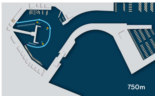
Recorrido Travesía ADAPTADA

Los nadadores con discapacidad que participen en la travesía larga se clasificarán junto con el resto de nadadores con criterio general