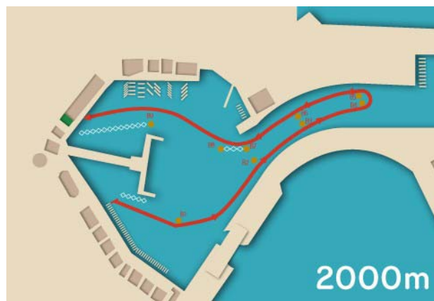
Recorrido Travesía Larga